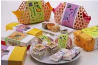
銀の馬車道マドレーヌ 他