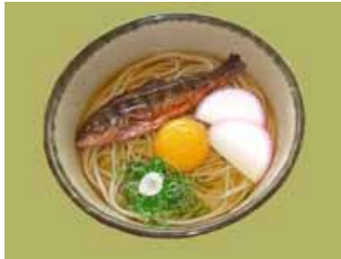
レストランメニュー「銀馬車 もちむぎ麺」